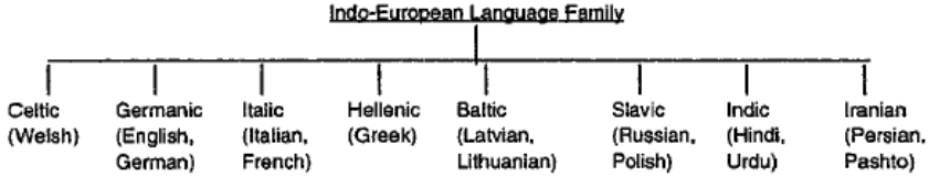
Şekil 5. Hint Avrupa dil ailesindeki dil kolları

söz varlığındaki ses değişimleri, Peştuncanın Hint (Sanskrit kolundan ziyâde İran koluna) yakınlığına tanıklık etmektedir.