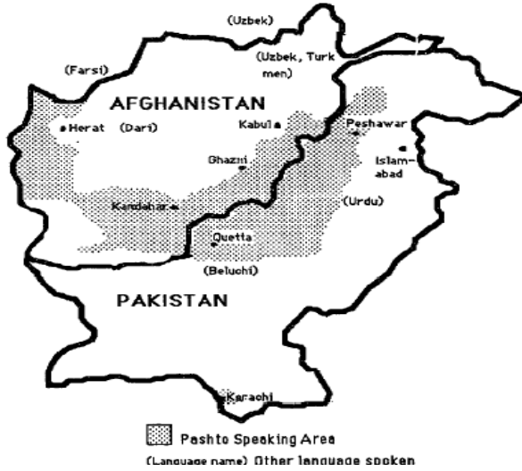
Sekil 1: Afganistan'da Peştuca ve diğer konuşulan diller